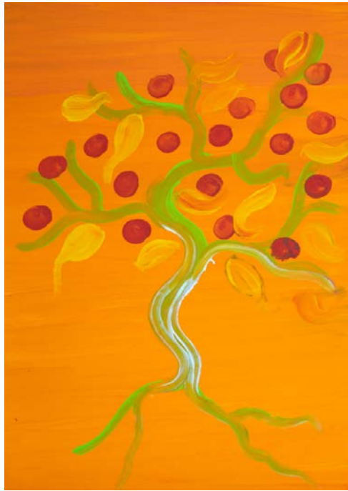
DM, Serie Lebensbaum

In allen Werken wird der Mensch spürbar in seiner Verletzlichkeit, seinen Sehnsüchten und Hoffnungen und seiner Fähigkeit, sich zu wandeln.